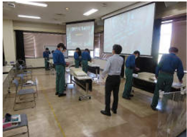
令和3年度 労働安全衛生特別教育(低圧)