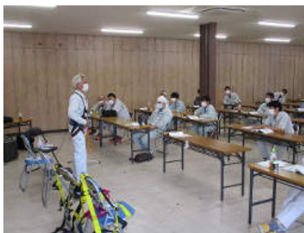
令和3年度 労働安全衛生特別教育(フルハーネス)