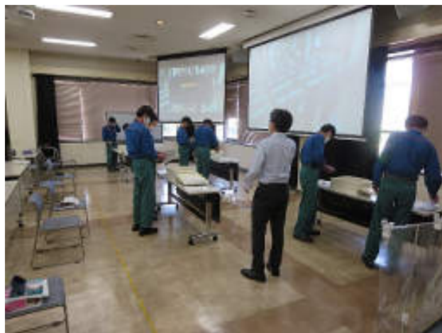
令和3年度 労働安全衛生特別教育(低圧)